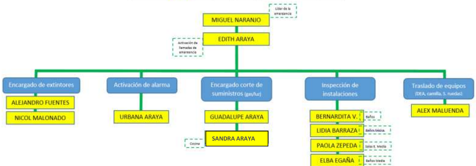
Comitiva de TITULAR emergencia (aplica a plan de emergencia y P.I.S.E)

Se designa como coordinador de seguridad escolar titular y suplente del establecimiento educacional a la siguiente persona, quien posee la máxima responsabilidad durante la emergencia, actuando como coordinador de esta, dirigiendo las operaciones de evacuación e intervención.